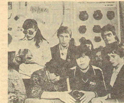
В музее истории.

тет. Здесь вчерашний школьник с помощью опытных, увлеченных своим делом преподавателей за 5 лет пройдет путь познания от первого человека, первобытного общества с его незамысловатой общественной организацией и простейшими орудиями труда до многообразного, сложного современного общества.