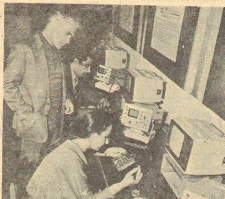
Работаем с ЭВМ.

Правда, это не значит, что на факультете нет недостатков. Они есть. Вот некоторые из них. Слишком свободно и вольно чувствуют себя студенты на физфаке. Ими трудно управ-