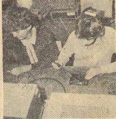
Основы информатики и вычислительной техники осваивают в институте студенты всех факультетов.

СО ВРЕМЕН Я. А. Коменского волнует нас проблема целесообразной (рациональной, оптимальной, эффективной) организации обучения школьников.