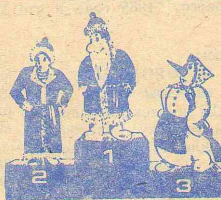
◆ Герои сезона.

Поймем за мелкой суетой — Они добры. Но все-таки Какую боль скрывают горы, чужие. О чем тоскует шар земной, И только письма, как всегда, твои.