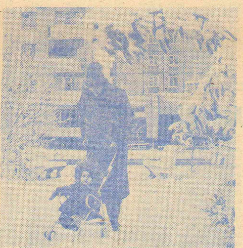
Один день зимы.