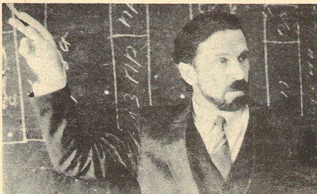
Более 100 лекций в год читает А. В. Минжуренко в трудовых коллективах и учебных заведениях города и области.

А. ПЛОТНИКОВ, ст. научный сотрудник ОмГУ.