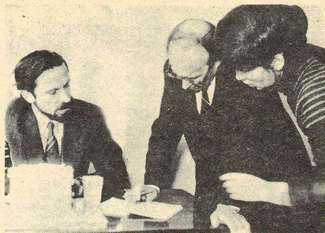
Обсуждаются проблемы научной работы кафедры.