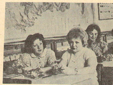
Идут занятия на ЕГФ.

торые осуществляют работу во всех направлениях студенческой жизни. Пока это эксперимент, но... Задача современной школы — раскрыть все дарования воспитанников. Но для этого сам учитель должен быть разносторонним человеком. Поэтому наш до-суг должен стать временем творчества, временем культурного развития. На те Подготовка специалистов для школы ведется на трех отделениях: «Химия и