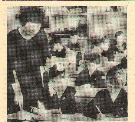
Идут занятия в школе

Здоровье студентов. Физическая культура и спорт. Материальная база.