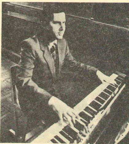
ДОВЕРЕННЫЕ ЛИЦА О. Н. СМОЛИНА.