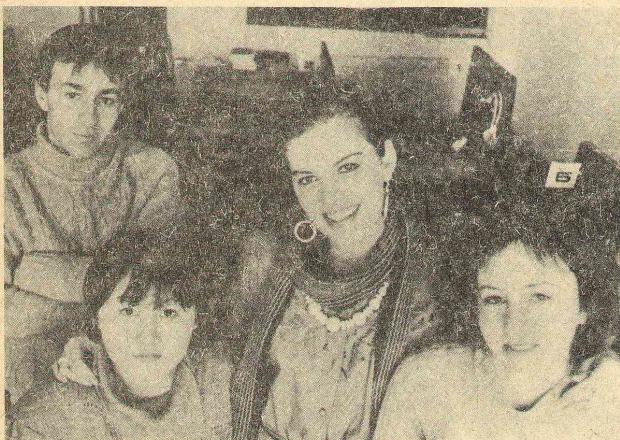
Как быстро пролетели пять лет! Сейчас уже студенты 504 группы ин. яз — выпускники. Пожелаем же им успешной работы.

И. МЕХА, декан исторического факультета.