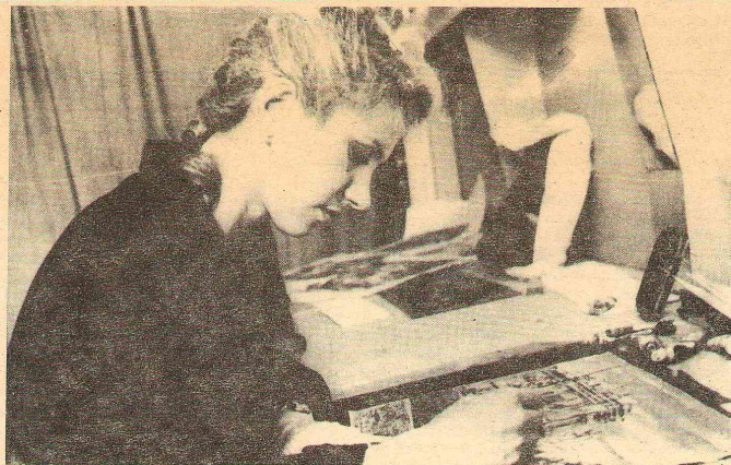
Целых пять лет отделяет сегодняшних первокурсников от будущих дипломных работ, над одной из которых сидит эта симпатичная выпускница хуграфовка. Но время пролетит быстро, и главное — не терять его напрасно, не транжирить на пустяки.

П. НИКОЛАЕВ, доцент кафедры истории СССР советского периода.