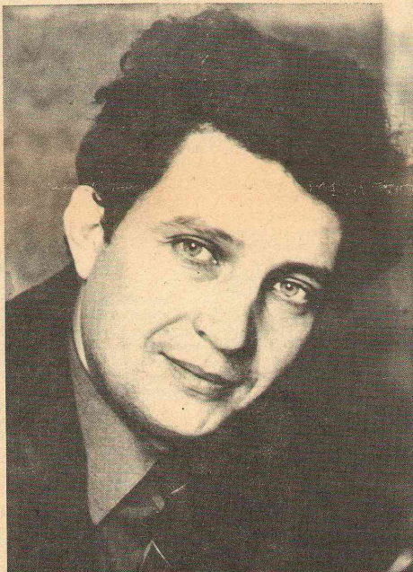
когда на стационар населяется еще и заочное отделение дошфака и начфака. Эту картину надо видеть!

— Наш ректор не золотая рыбка, а, прошу прощения, рабочий конь, который впрягается в воз и пытаясь продернуть его дальше наезженной колеи. И в этом случае он сам нуждается в поддержке. На вопросы ответил В. СЛОБОДЯН.