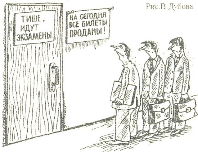
Рис. В. Дубова.

Найдены документы студентки И.В.Видершман. Обращаться по тел. 69-60-63.