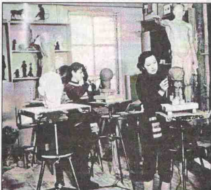
В скульптурной мастерской.

С 1970 — начала 1980-х факультет активно влияет на художественную жизнь родного города. Выпускники пополняют ряды членов молодёжного объединения