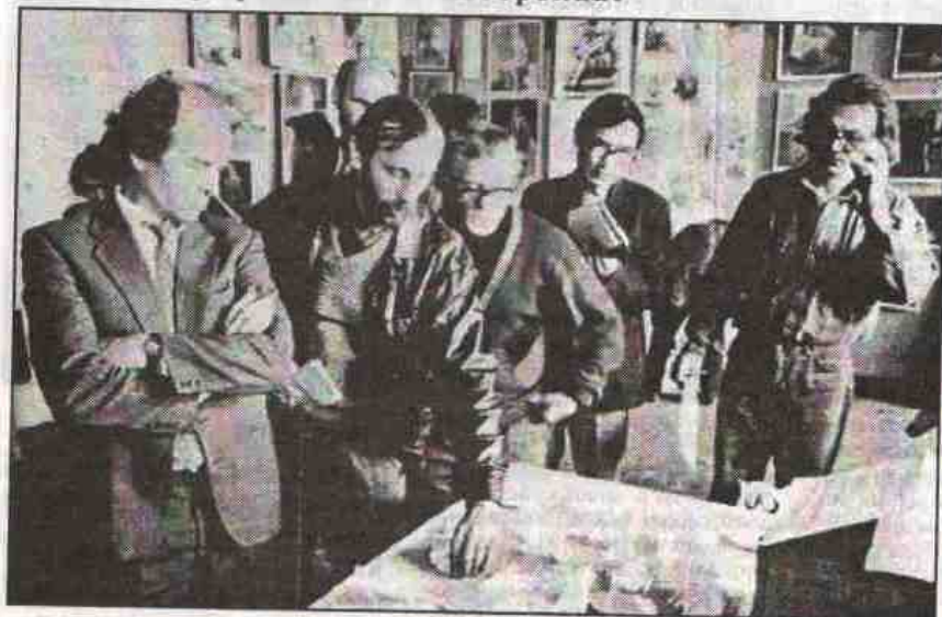
Просмотр учебных работ.