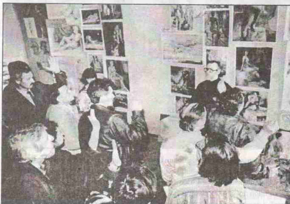
Просмотр учебных работ 1996 г.

В 1978 году произошло выделение кафедры декора-