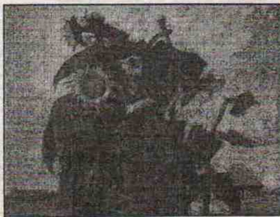
"Подсолнухи". 1998-99 гг.