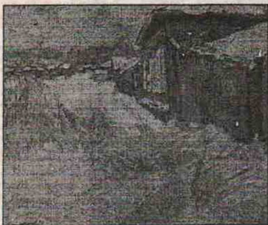
"Март на Моховой". 1996 г.

ясь вечного бумажного кораблика в дворном море... Г.Баймуханов пишет переходные состояния, самую трудноуловимую часть природного бытия. Любит и другого рода грань - земля и вода (вертикаль земляного, древесного склона над