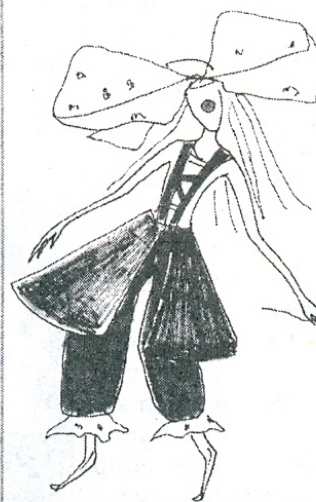
Фото театра «Шумим». Художник Валентина Старпович.

Хорошо, что они есть – эти забавно-нелепые чудаки, от которых мир становится чуть смешнее, а значит, добрее.