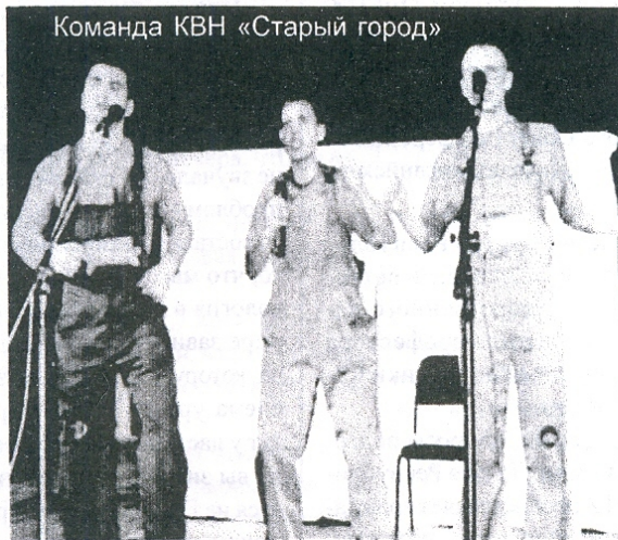
Команда КВН «Старый город»

В научно исследовательской работе ежегодно принимают участие около 700 студентов нашего учебного заведения. По итогам студенческих конференций издаются и публикуются научные сборники. Создано студенческое научное общество.