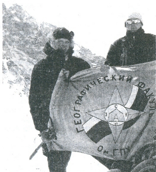
Восточные Саяны, перевал Музувек 2820 м.

Вместе с тем география — наука молодая. Сегодня она является одной из базовых наук, исследующих проблемы окружающей среды. Взаимоотношения природы и общества, рациональное природопользование, региональное развитие и территориальное управление, взаимодействие океана и атмосферы, космические методы исследования, электронное картографирование, создание географических информационных систем (ГИС) и атласов, геоэкология — всё это малая часть того, чем занимается современная география.