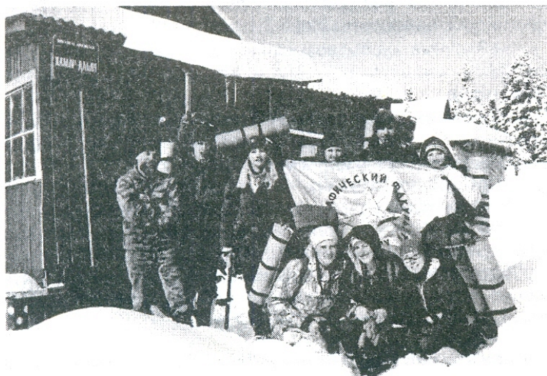
Хребет Хамар-Дабан. Высокогорная метеостанция 3068 м.

География практик студентов факультета достаточно широка: в России это Сочи, Адлер, Красная Поляна, Горная Шория, Республика Алтай, Санкт-Петербург и др. Ближнее зарубежье — Казахстан, Украина (Крым). Дальнее зарубежье — Турция, о. Сицилия, страны Европы и др. В рамках практик