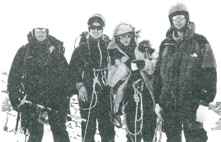
Алтай. Вершина Купол 3500 м.

Студенты, обучающиеся на специальности «Социально-культурный сервис и туризм», с первых курсов начинают осваивать навыки работы в туристической отрасли и это ещё одна примечательная черта факультета. На факультете преподают доктора и кандидаты наук, а также руководители туристических агентств и гостиничных комплексов. В ходе учебных и производственных практик студенты посещают рекреационные системы различных регионов.