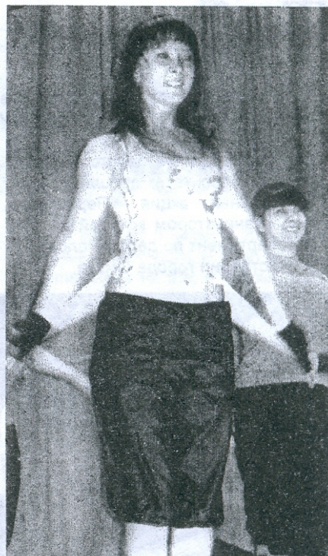
Ансамбль «Грация», физический факультет