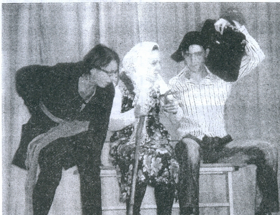
Миниатюра «Ностальгия», химико-биологический факультет