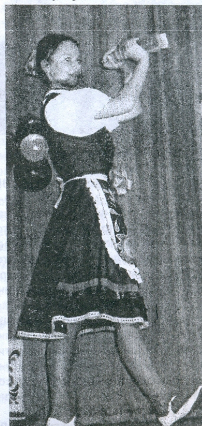
Плоских София, русский народный танец