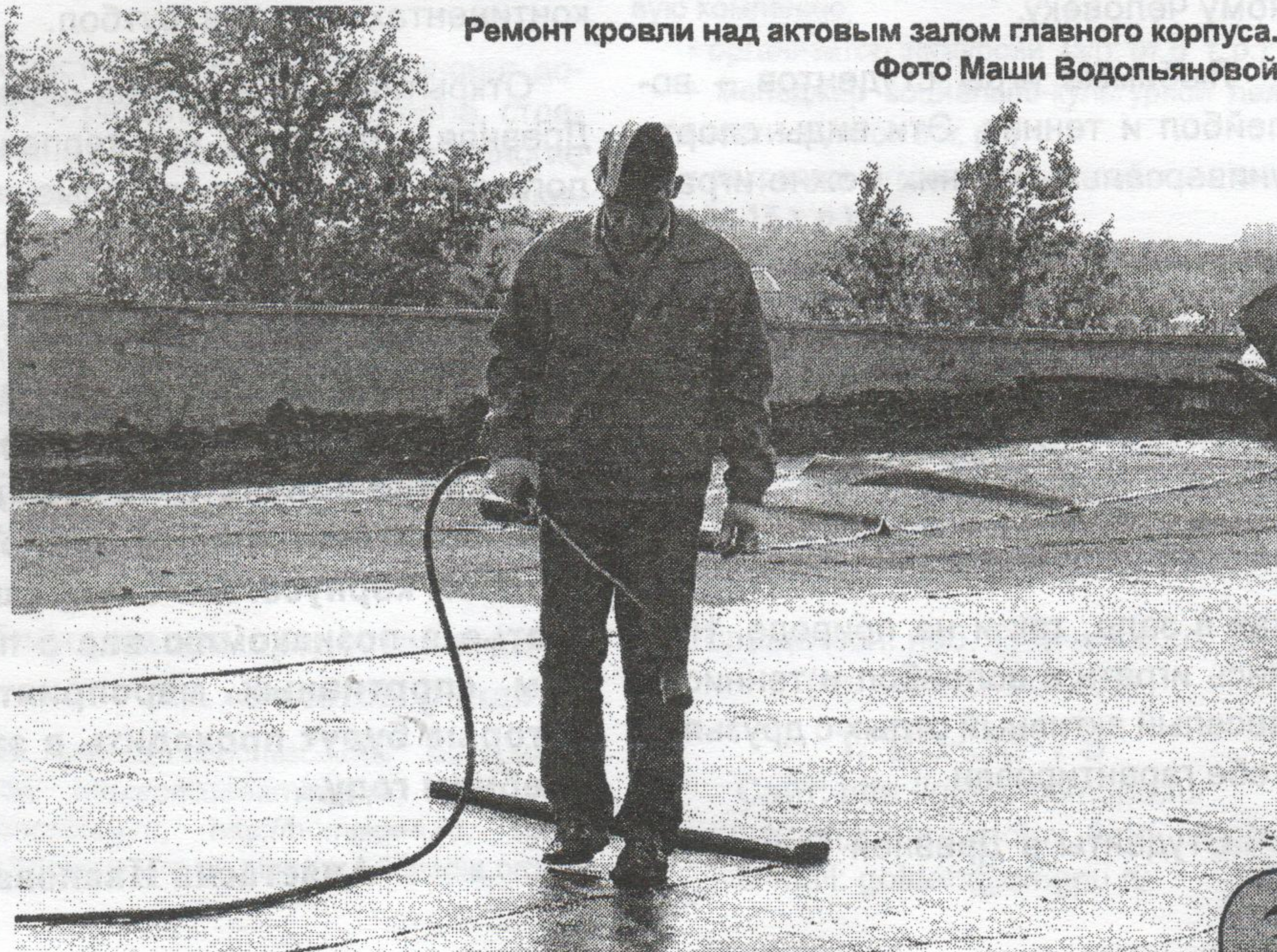
Ремонт кровли над актовым залом главного корпуса.

Ну что ж, надеемся, что сотрудникам административно-хозяйственной части удастся выполнить намеченные планы, а мы, в свою очередь, скажем спасибо всем тем, кто обеспечивает нам комфорт, чистоту и порядок!