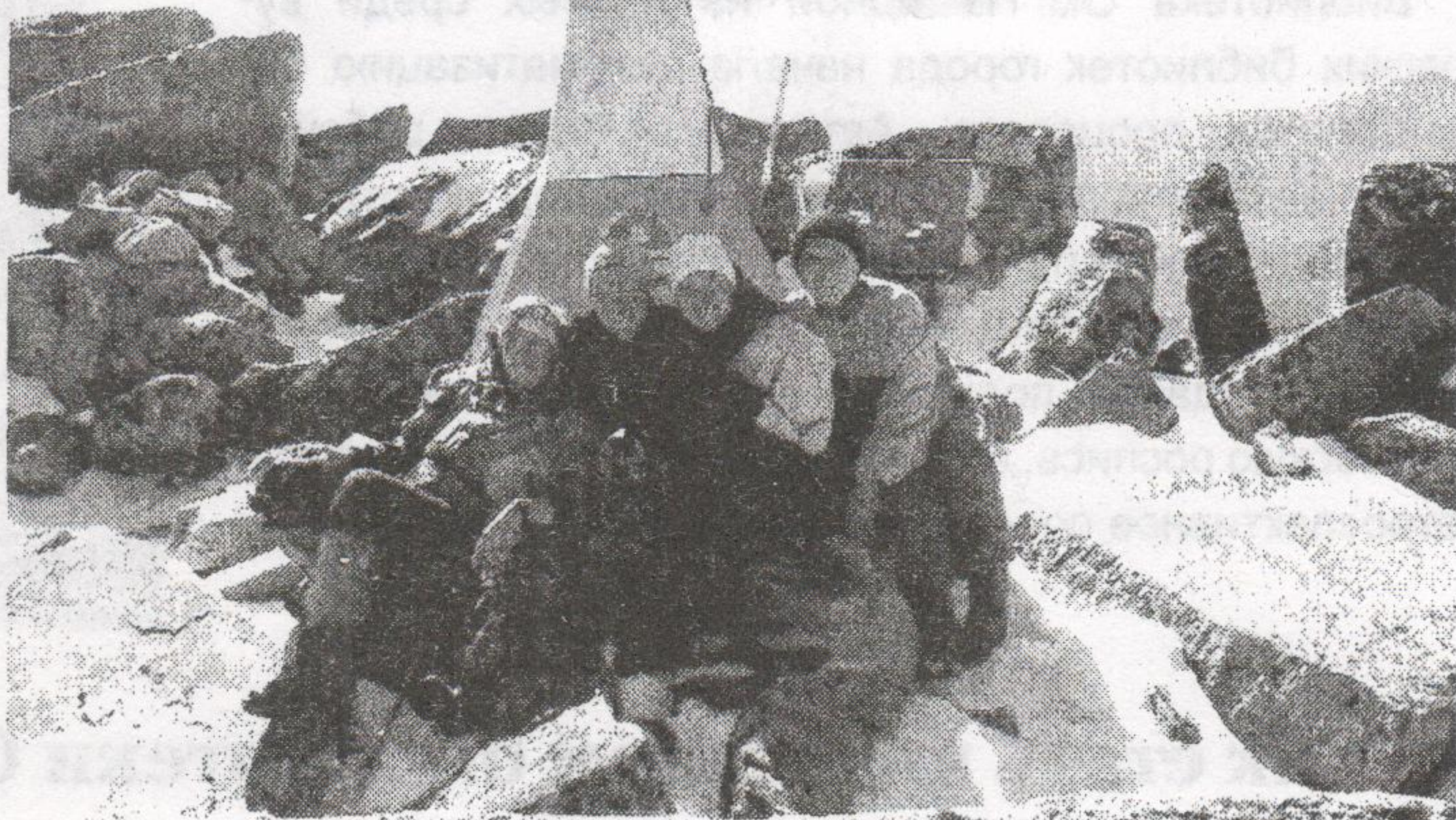
Высочайшая вершина Уральских гор – гора Народная

что этот поход был самым холодным (выпадение снега на высоте от 1150 метров и выше, сильный ветер, ночные заморозки, многочисленные броды через ледяные реки – и это неудивительно, ведь до полярного круга каких-то 100 км), от него остались самые теплые воспоминания. Больше всего запомнились бескрайние просторы Приполярья, удивительные формы горных вершин, яркие тундровые краски, несметное количество ягод и грибов, сказочные леса, хрустальные горные реки. Полное отсутствие людей создавало неповторимое ощущение того, что кроме нас никого нет на этой чудесной планете. Планете, которая, несмотря на всю свою суровость, всеми силами помогает нам выжить и делает нас счастливыми.