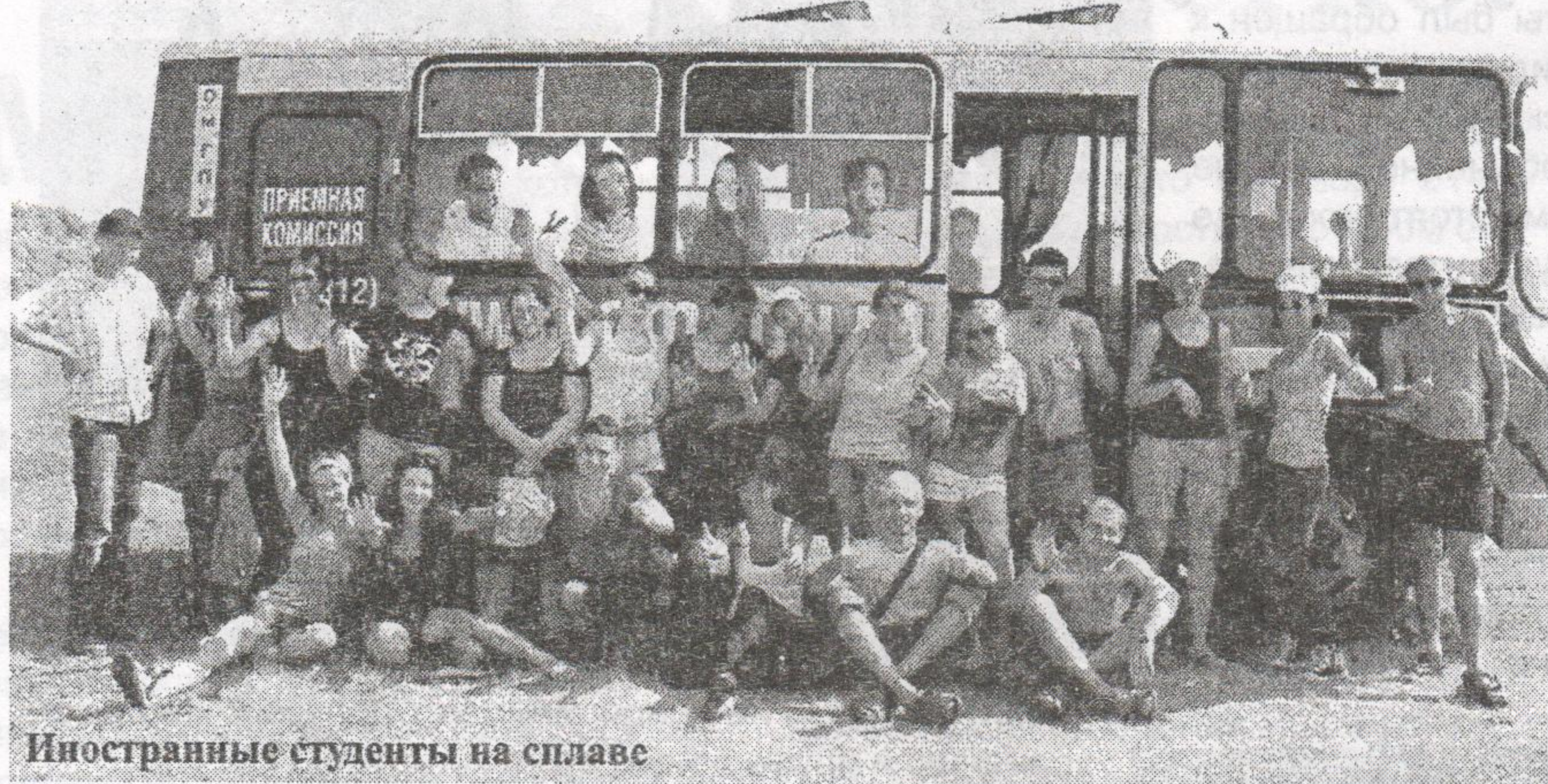
Иностранные студенты на сплаве

Все больше иностранных граждан приезжает в Омск, чтобы узнать культуру и быт России, познакомиться с «великим и могучим» русским языком или улучшить свои языковые знания. Такую возможность предоставляет ОмГПУ, который этим летом, по традиции, превратился в место встречи молодых людей из Германии, Австрии, Франции, Бельгии, Италии, Китая, Японии и Нидерландов. С 1 по 23 августа в нашем университете проходили две школы: летняя школа русского языка и летняя экологическая школа. Обе школы представляли собой два интенсивных курса с обширной образовательной и культурной программой. Торжественное открытие, знакомство с преподавателями, структурой курсов и планом мероприятий состоялось 1 августа. Во время обзорной экскурсии, которая получила название «Советы для повседневной жизни в Омске», сотрудники отдела международного сотрудничества ОмГПУ и волонтеры – студенты последних курсов – познакомили ребят с местными достопримечательностями, особенностями российского уклада жизни, рассказали о климатических и иных особенностях пребывания в Омске. Занятия начались уже на следующий день и закончились итоговым тестированием и защитой индивидуальных проектов.