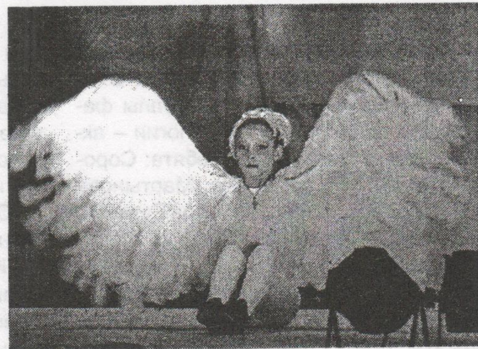
25 апреля. Концерт

Ярким и зажигательным концертом запомнился нам день 25 апреля. Мы встречали гостей из десяти коррекционных школ и детских домов. Перед концертом ребятам была предложена увлекательная игра, в которой нужно было выполнить шуточные задания, разгадать загадки, угадать мелодии или сказочного героя, а затем выиграть подарок в лотерею. Далее все были приглашены в актовый зал, где гостей встретили «бременские музыканты» с концертной программой «Тем, кто дружен, не страшны тревоги». В мероприятии приняли участие творческие и студенческие коллективы ОмГПУ и дети из коррекционных школ и детских домов Омска. Были представлены танцы и спортивные этюды, исполнены песни и стихи. Закончился концерт вручением воздушных шаров и подарков. Выражаем