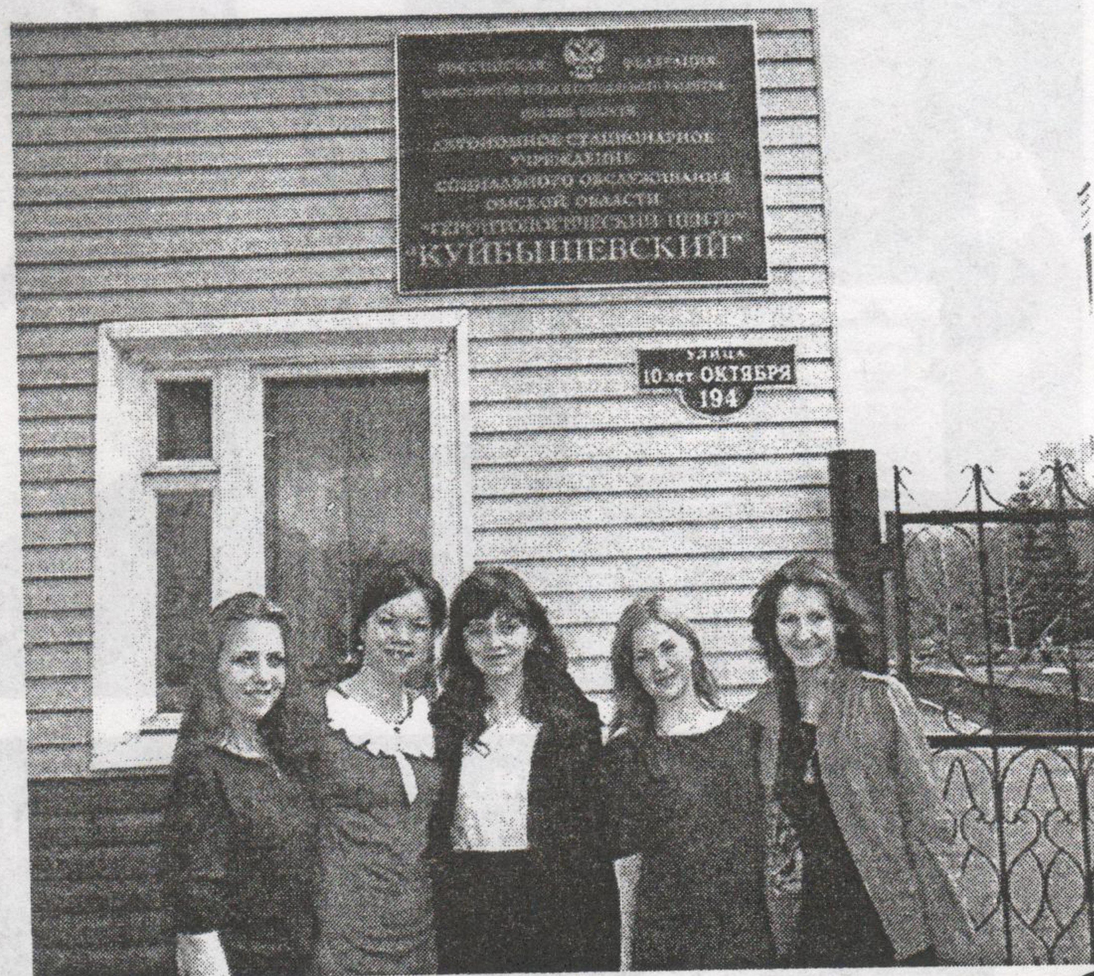
Волонтеры в геронтологическом центре «Куйбышевский»