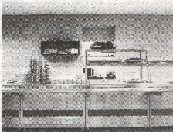
Столовая корпуса №2.