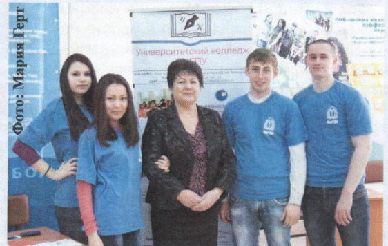
Представители колледжа ОмГПУ

С 1 по 4 апреля на базе средней общеобразовательной школы №24 начал работу «Полигон профессиональных проб «Вкус карьеры». Вузы, колледжи, техникумы, учебные центры создали интерактивную площадку, где старшеклассники смогли «попробовать профессию на вкус». У школьников была возможность узнать больше об учебных заведениях Омска, задать свои вопросы экспертам в сфере образования, а также пройти собеседование. Омский государственный педагогический университет принял активное участие в данном мероприятии. Старшеклассникам была представлена выставочная площадка, где студенты вуза знакомили их с основными и дополнительными программами профессиональной подготовки, реализуемыми в ОмГПУ. Представители факультетов подготовили презентации: например, факультет естественнонаучного образования продемонстрировал химические опыты, а все желающие смогли разобрать и собрать автомат Калашникова, посмотреть под микроскопом строение различных простейших микроорганизмов.