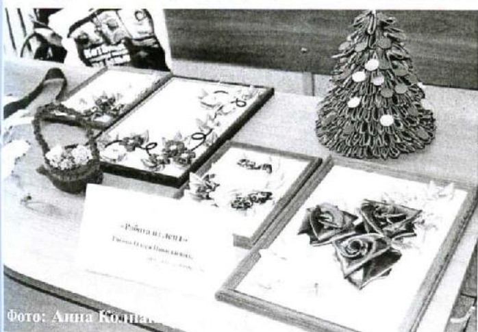
Мастер-класс: «Работа из лент»