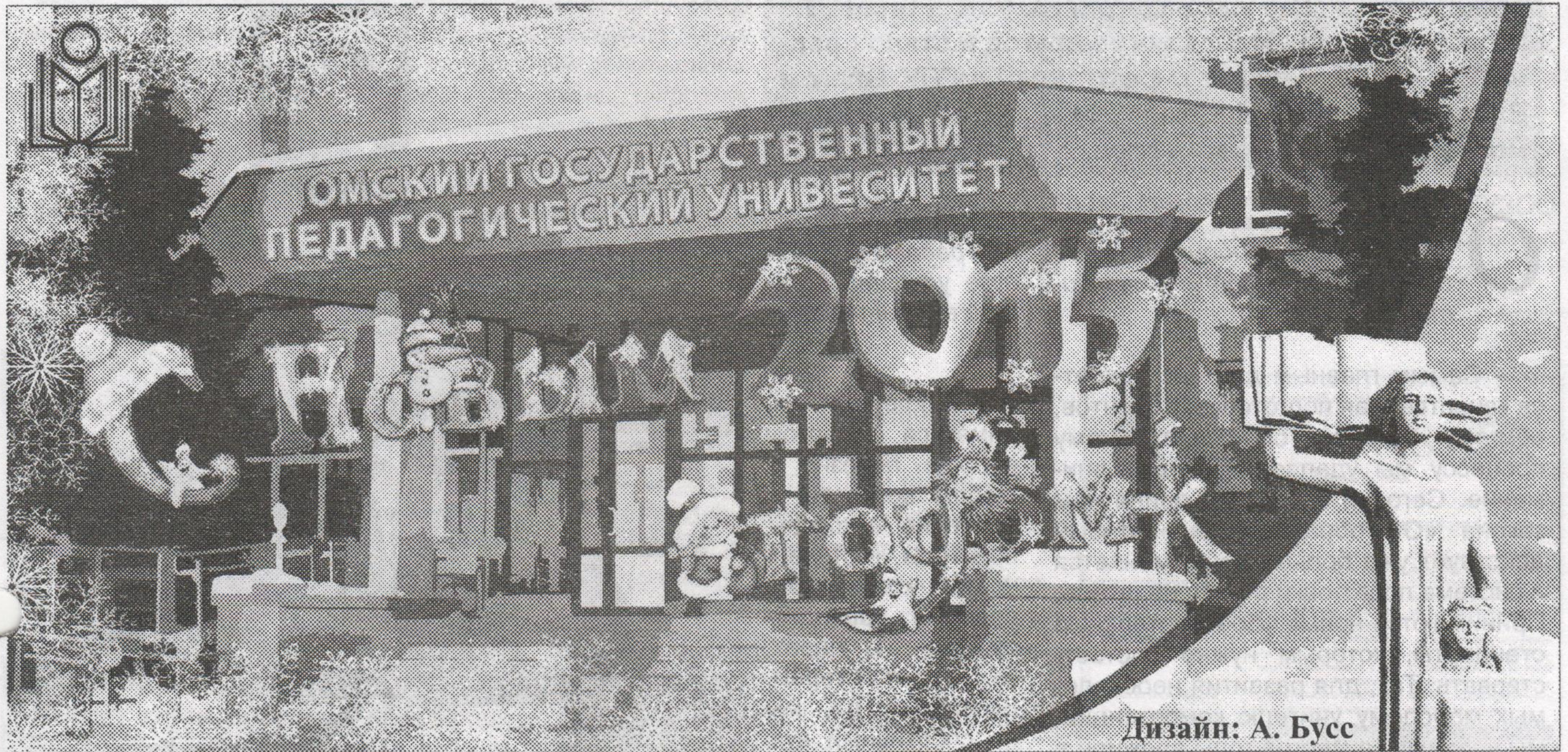
Дизайн: А. Бусс