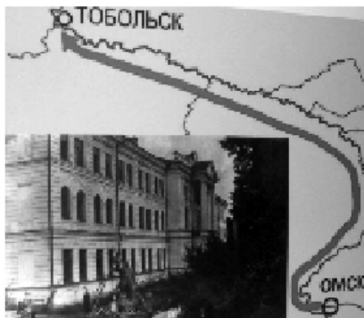
Тобольский учительский институт

Первый период был непродолжительным, поскольку уже в июле вышел приказ переехать в Тобольск (относившийся тогда к Омской области).