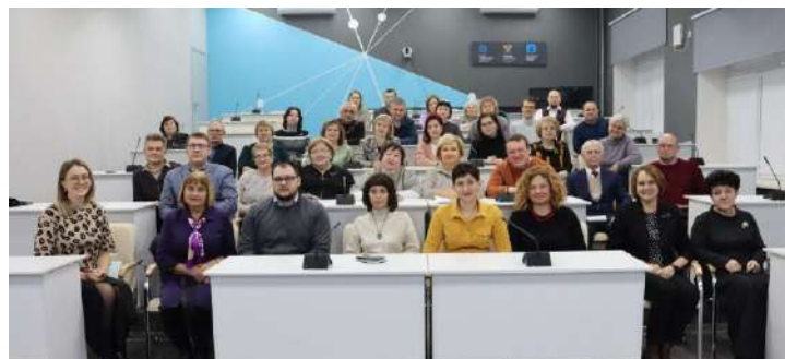
✍ Пресс-служба ОмГПУ

Желаем новому составу Совета плодотворной работы!