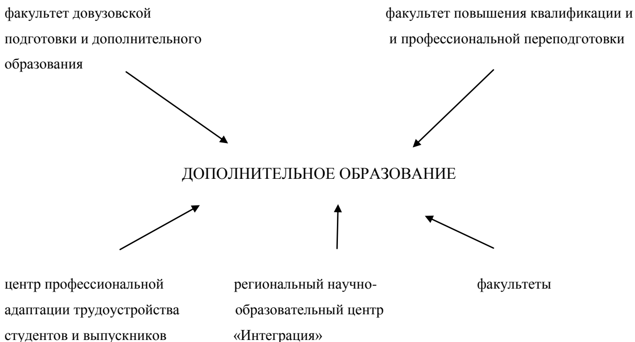
Схема 1. Структура дополнительного образования в ОмГПУ

В 2018 году в Омском государственном университете обучалось 3883 слушателя по 142 программам дополнительного образования. Обучение проводилось в различных формах: лекции, семинары, мастер-классы, тренинги, стажировки и др. в том числе с использованием дистанционных образовательных технологий. Активно используется накопительная модульная система.