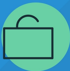
Сельские продуктовые магазины