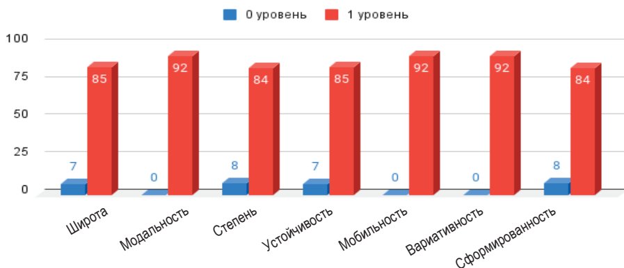
Рис. 1. Показатели сформированности неформальной образовательной среды контрольного этапа исследования

Заключительный этап опытно-экспериментальной работы (2020–2022) был посвящен проверке результативности педагогических условий интеграции формального и неформального образования в профессиональной подготовке студентов колледжей. В нём приняло участие 60 преподавателей и 92 студента Омского колледжа культуры и искусств.