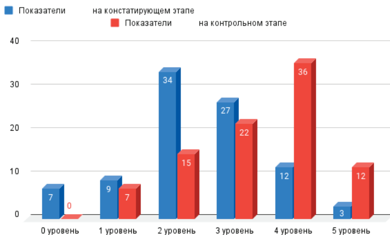
Рис. 2. Уровень вовлеченности студентов в неформальное образование