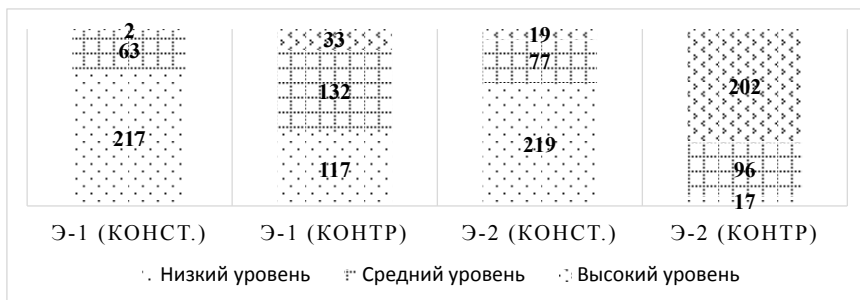
Рис. 2. Динамика уровня готовности к выбору педагогической профессии у школьников в экосистемах ориентации школьников на педагогическую профессию первого и второго типов

** — контрольный этап опытно-экспериментальной работы.